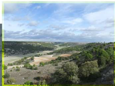
Valle de Valimón