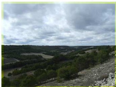
Valle de Valdecascón