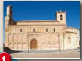
Iglesia de San Juan Bautista. S. XI-XII