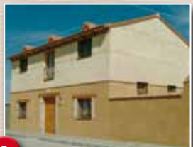
Casa Rural «La Cañada»