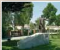
PARQUE EL QUINTO