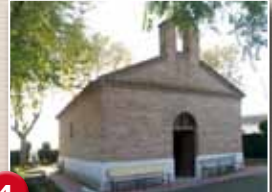
Ermita de la Virgen de la Soledad.