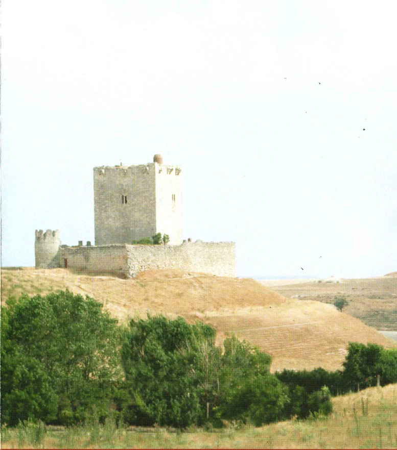
Edición: Grupo Página [t. 983 395 111]