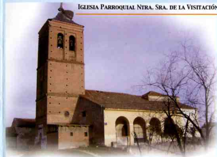
IGLESIA PARROQUIAL NTRA. SRA. DE LA VISITACIÓN

Además de todo lo mencionado hasta este momento habría que añadir que puede ser de especial agrado para el turista, adquirir conocimientos sobre los diferentes escudos que se encuentran en el municipio, así como conocer la arquitectura de barro, seña de identidad de Castilla y tendente a su desaparición, de la que se puede disfrutar en este municipio, haciendo así que pueda ser conocida y traspasada a generaciones futuras.