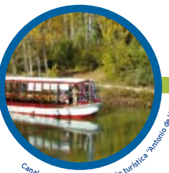
Canal de Castilla. Embarcación turística "Antonio de Ulloa".