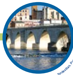
Tordesillas. Puente medieval.