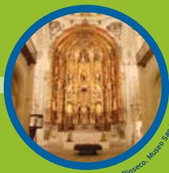
Medina de Rioseco. Museo San Francisco.