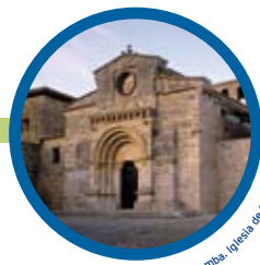
Vambra. Iglesia de Santa María.