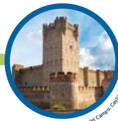
Medina del Campo. Castillo de la Mota.