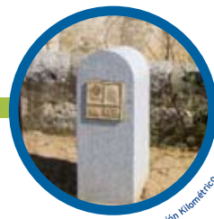
Mojón kilométrico en Simancas.