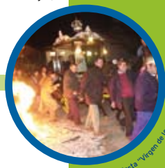
Nava del Rey. Fiesta "Virgen de las Plegarias".