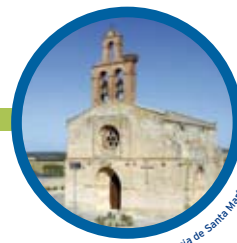
Castronuño. Iglesia de Santa María del Castillo.